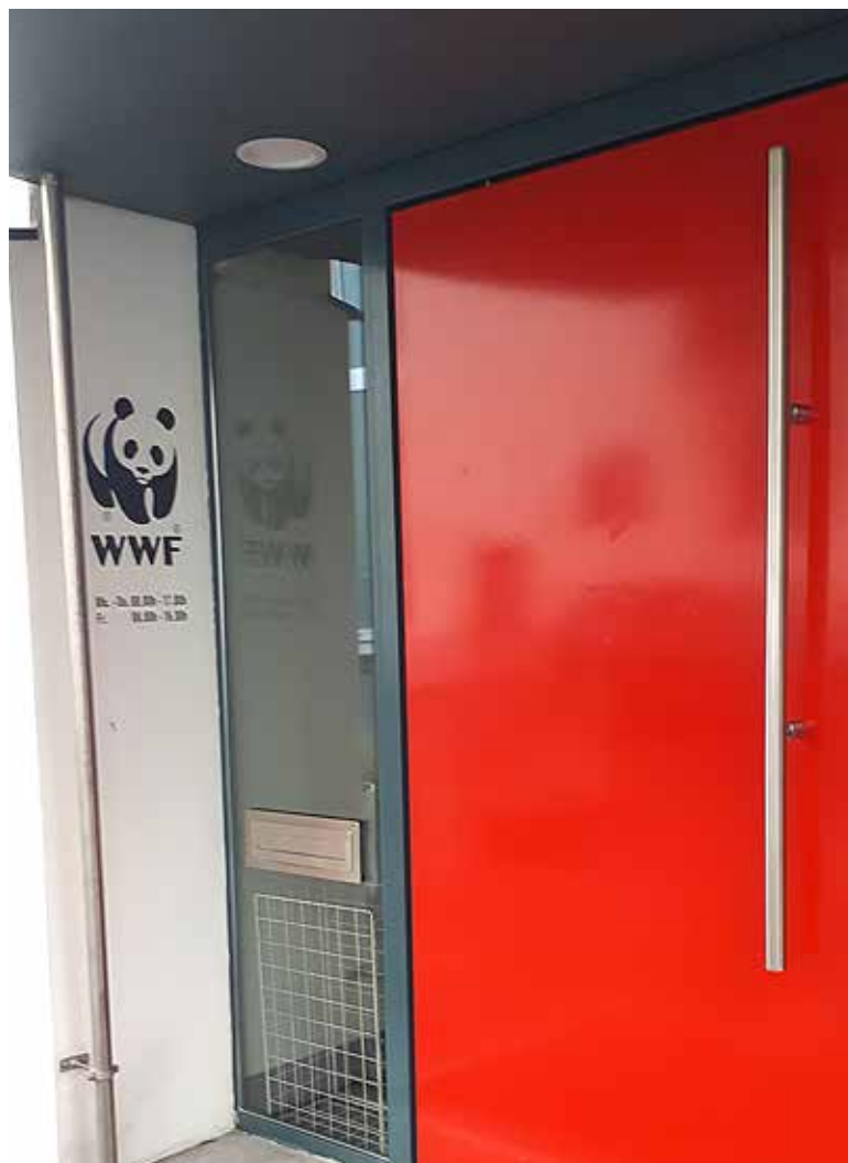
Der Pandabär begleitet unsere junge Autorin täglich bei ihrer Arbeit für den WWF.

Und so sehr mir die Schüler fehlen, die Bücher und die Lektionsvorbereitungen, so sehr geniesse ich es gerade, eine neue Welt kennenzulernen, die mir die Uni nicht zeigen konnte. Mal sehen, wohin es mich führt.