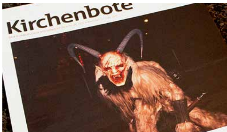
«Gfürchig»: Der Teufel auf dem St. Galler Kirchenboten.

In der Tat: Auf dem Cover der jüngsten Ausgabe des St. Galler Kirchenboten prangt die diabolische Fratze eines Teufels. Die Ausgabe widmet sich in der Fastnachtszeit dem Satanischen. Die traditionellen Holzmasken würden derzeit von jungen Fastnachtsgruppen möglichst schauerlich dargestellt, erzählt Andreas Schwendener, Chefredaktor des St. Galler Kirchenblatts –