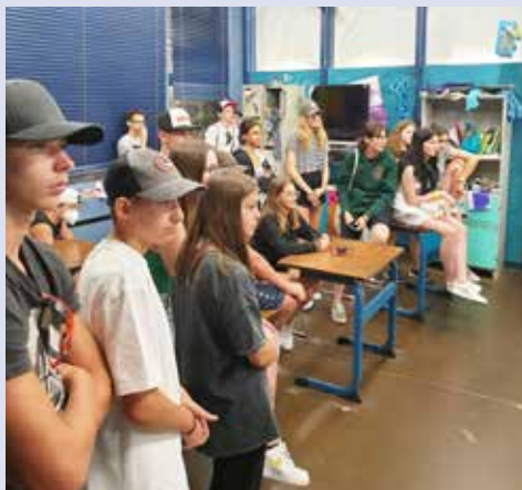
Im Klassenzimmer vom Film «Fuck ju Göthe» in den Bavaria Filmstudios.

«Ihr seid das Salz der Erde, ihr seid das Licht der Welt.» Das habe ich auch wieder in der letzten Sommerferienwoche gedacht, als wir mit 26 Jugendlichen fünf Tage im