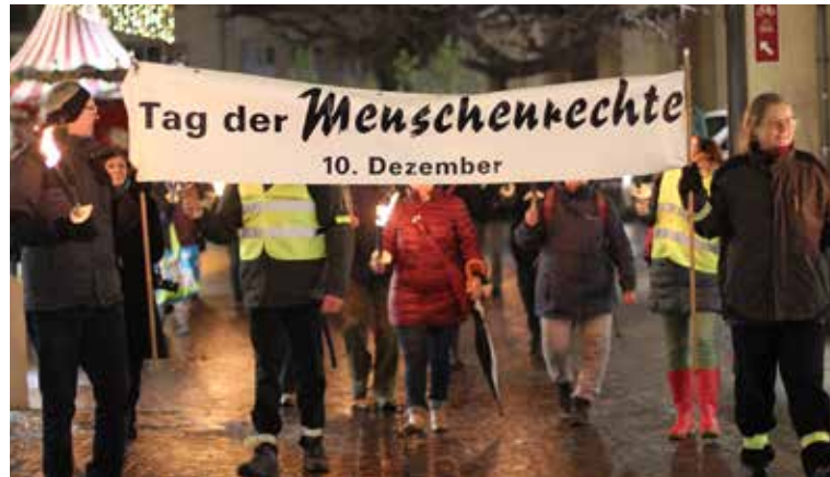
Die Kirchen gehen in Olten für die Menschenrechte auf die Strasse. Sollen sie so politisieren?